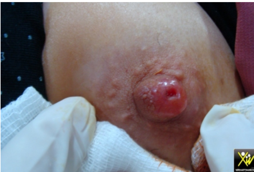
Ulcération séro-sanglante d'un mamelon.