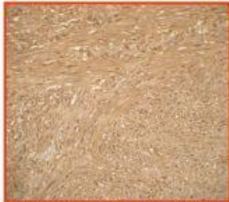
Expression nucléaire des cellules par la PS100 (immuno-histochimie)