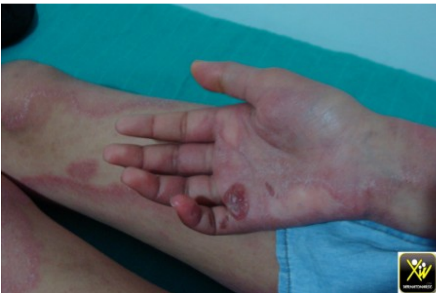
Plaques tumefiees, insensibles avec griffe cubitale et PFP.