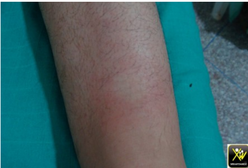
Plaques tumefiées, insensibles avec griffe cubitale et PFP.