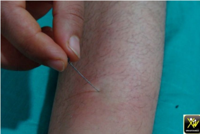
Plaques tumefiées, insensibles avec griffe cubitale et PFP.