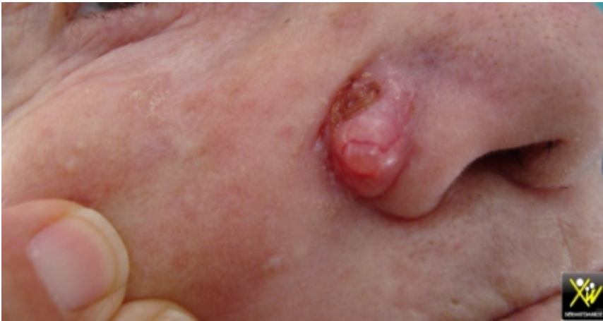
Tumeur lisse parcourue de télangiectasies

Le souci esthétique et l'augmentation du volume de cette tumeur de l'aile du nez