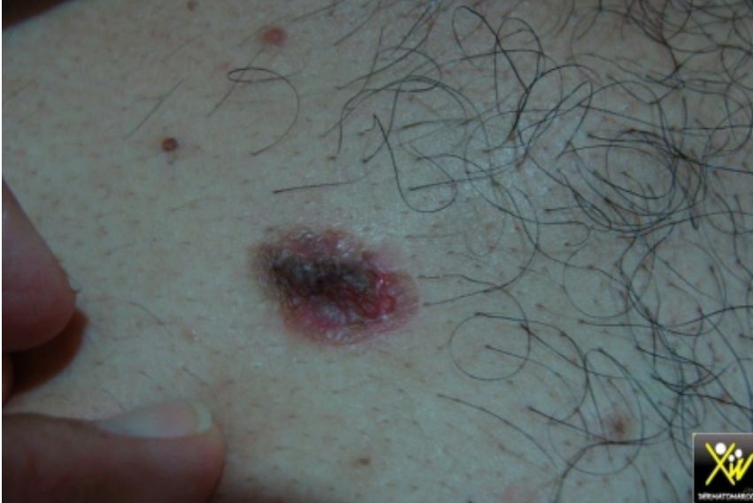
Bulles flasques de l'adulte

Le motif de consultation de ce patient est des Bulles flasques,