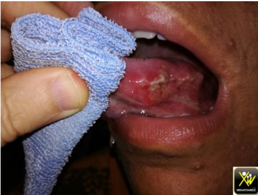
Tumeur de la langue.

Ce jeune adolescent de 16 ans, non fumeur, consulte