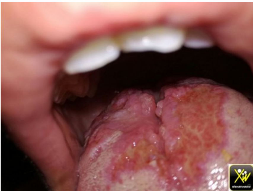
Tumeur de la langue.