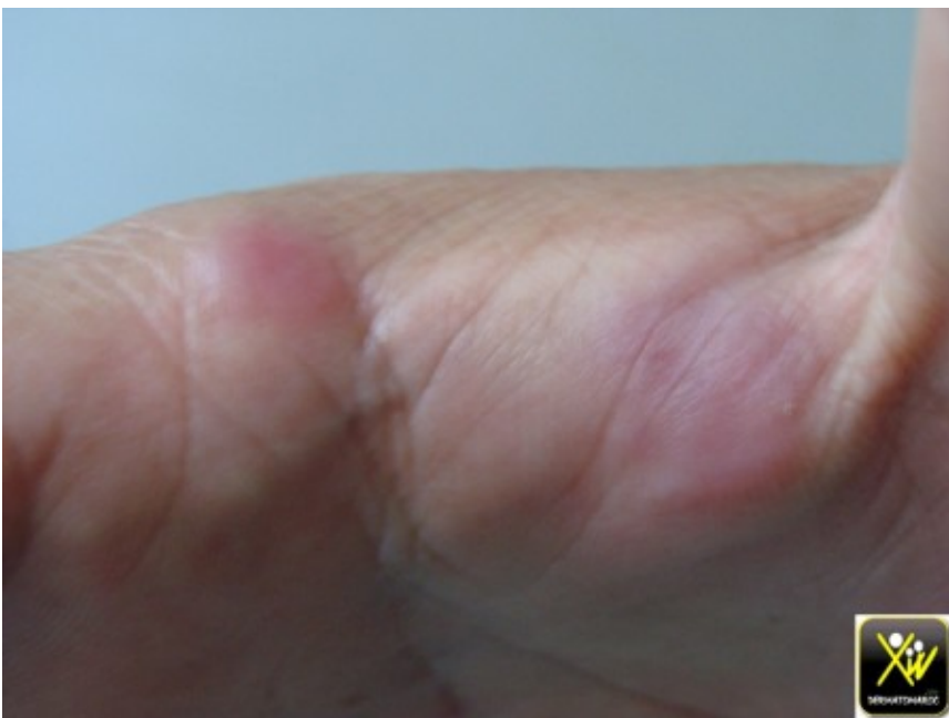
Papules douloureuses avec fièvre et hyperleucocytose.