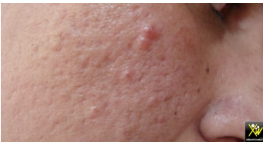
Nodules faciales chez une jeune femme

l'examen retrouve des nodules similaires sur le tronc.