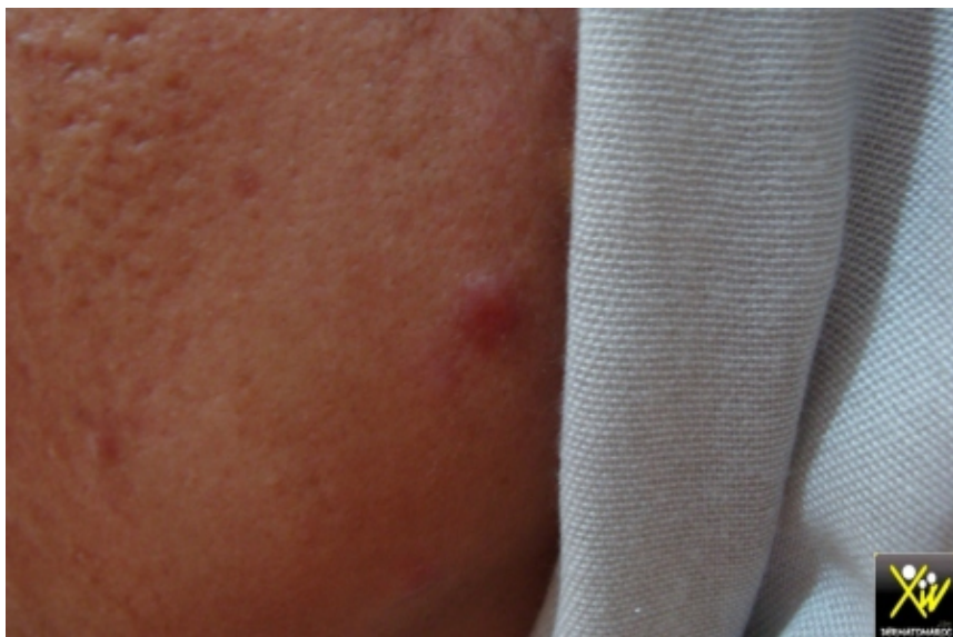
Nodules faciales chez une jeune femme

Cette jeune femme consulte pour la multiplication récente de nodules sur le visage,