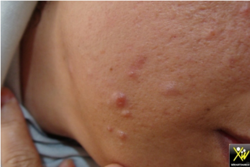
Nodules faciales chez une jeune femme