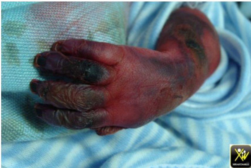
Ischémie aiguë du membre supérieure.

Ce nouveau né présente une Ischémie aiguë du membre supérieure dans un contexte de bon état général.