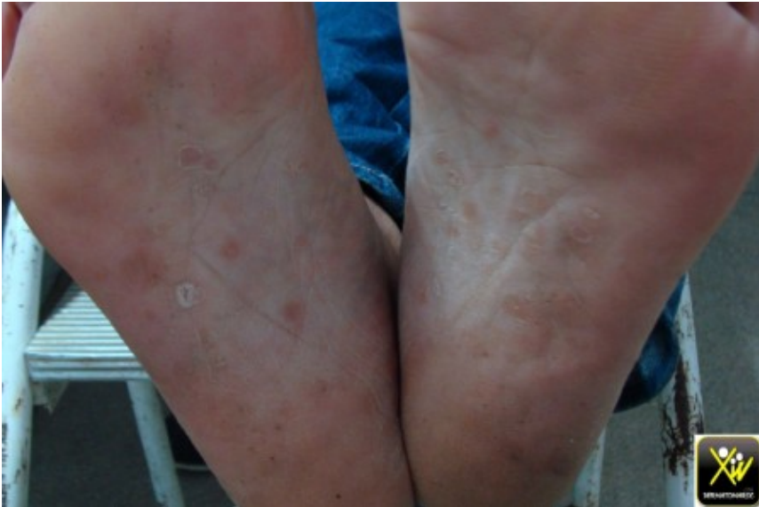
Plaques d'alopecie et lésions palmo plantaires