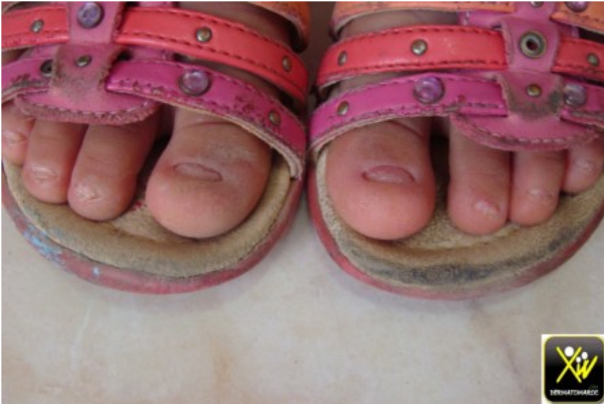
Dystrophie unguéale familiale