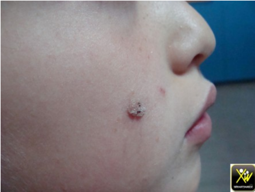
Verrue de la face.