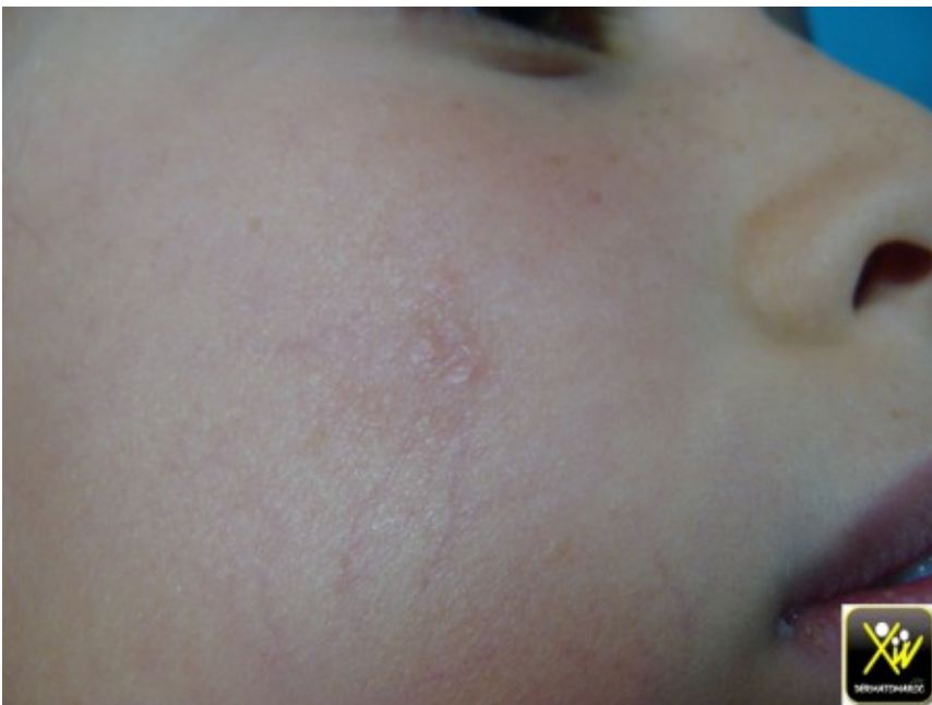
Verrue de la face.

Un keratolytique a forte concentration après avoir protégé la peau periverrue par une pommade type vaseline.