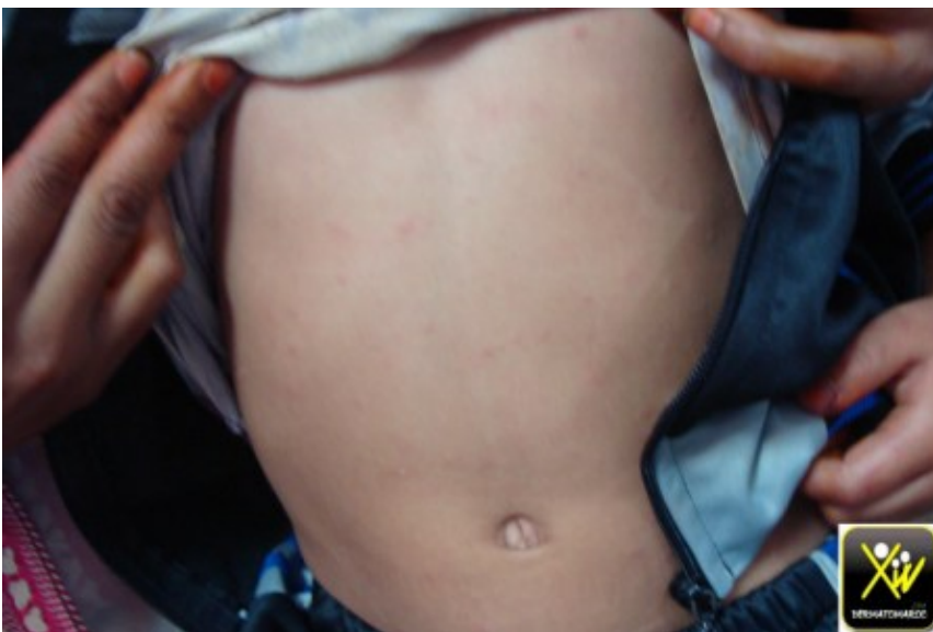
Syndrome cutanéomuqueux fébrile

l'examen trouve une éruption cutanée associée a des oedemes des extrémités, une conjonctivite,