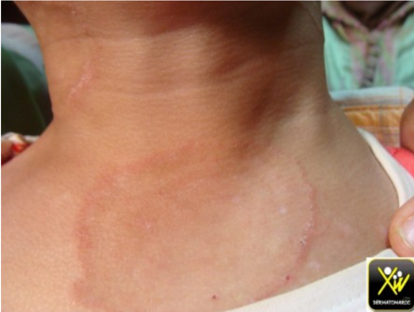
Érythème centrifuge prurigineux

Cet enfant consulte pour un Érythème centrifuge prurigineux, Quel est le seul