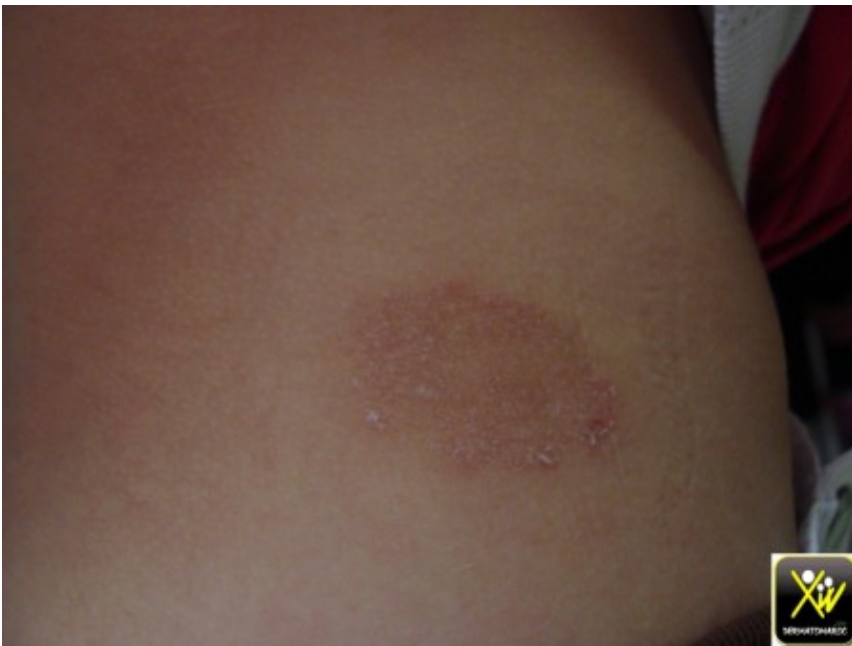
Plaque squameuse et chute des cheveux.

Cet enfant consulte pour une plaque squameuse prurigineuse qui s'étend progressivement associée a une plaque de chute des cheveux et qui est squameuse.