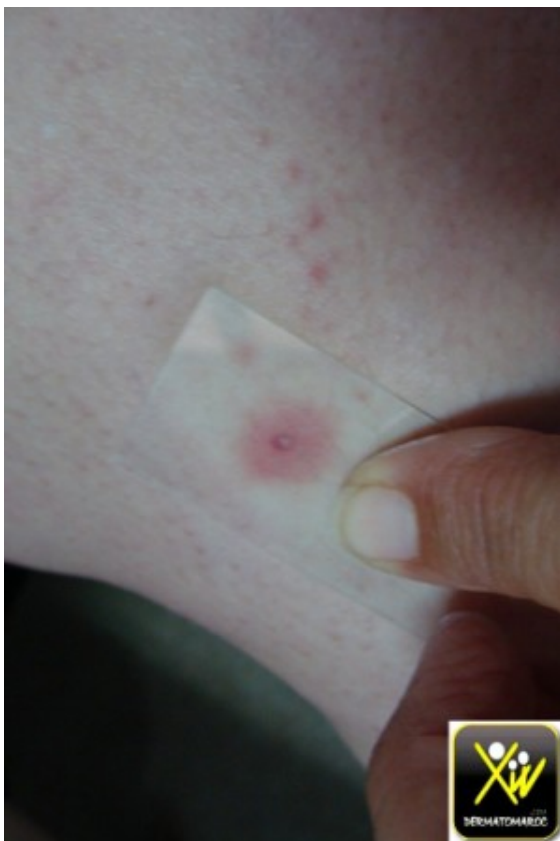
Purpura et douleur.

Cet enfant consulte pour des douleurs abdominales diffuses associées a des arthralgies.