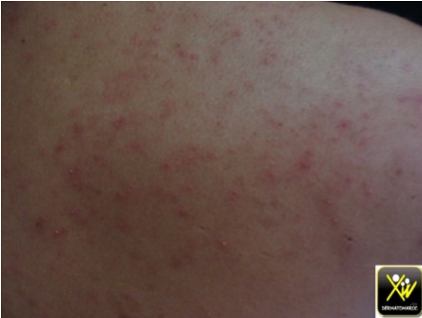
Acné monomorphe explosive.