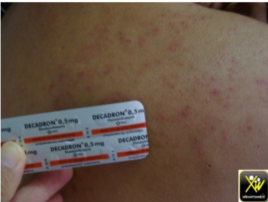
Acné monomorphe explosive.

Des corticoïdes per os sont conseillés auprès de la pharmacie pour avoir de l'appétit.