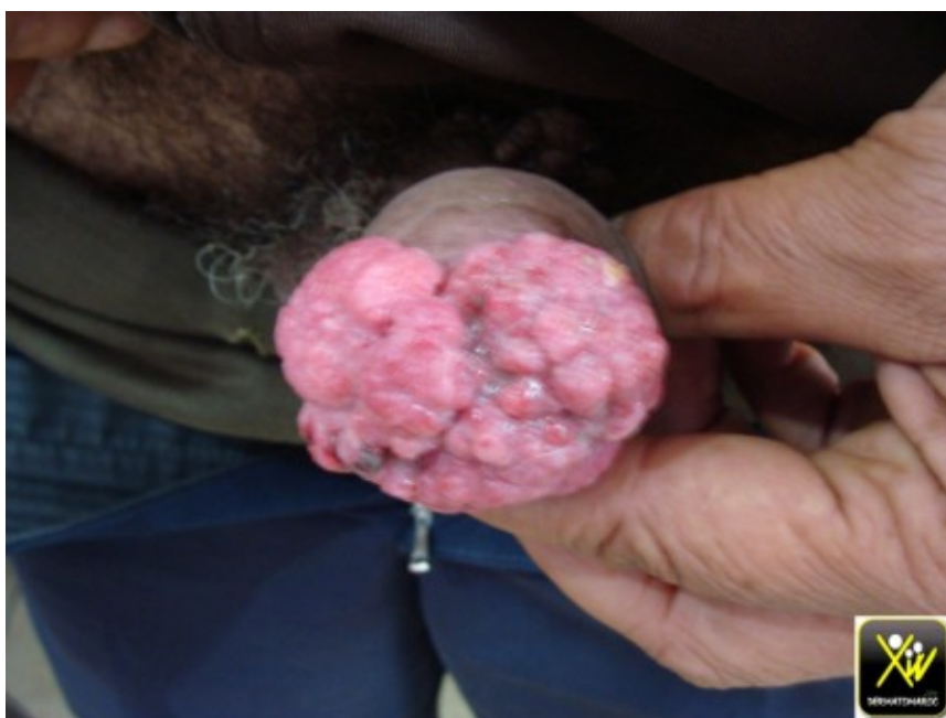
Tumeur bourgeonnante de la verge.

Ce patient consulte pour une Tumeur bourgeonnante de la verge.