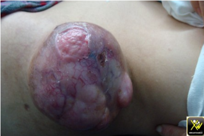
DFS Darrier ferrand