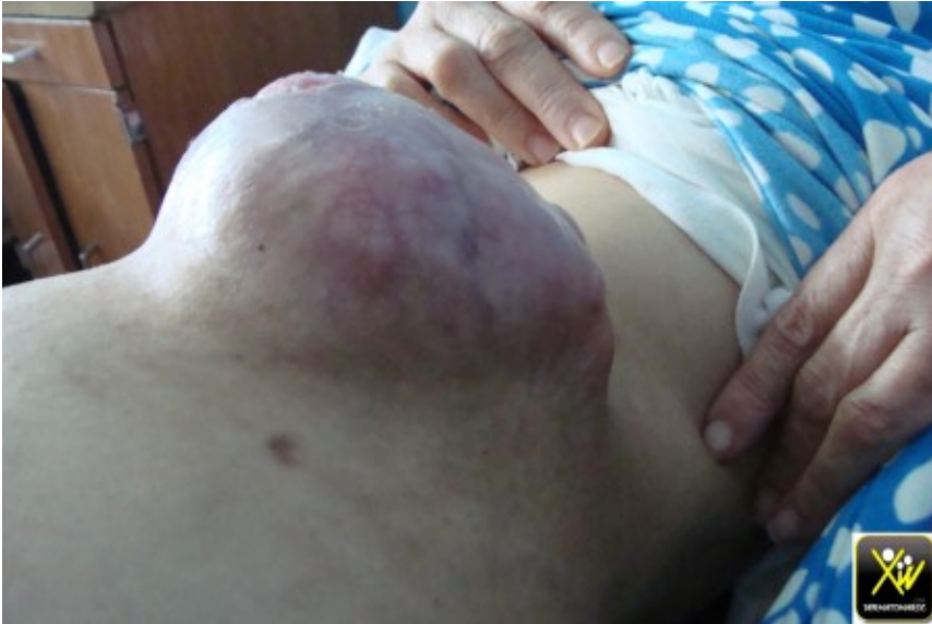
DFS Darrier ferrand