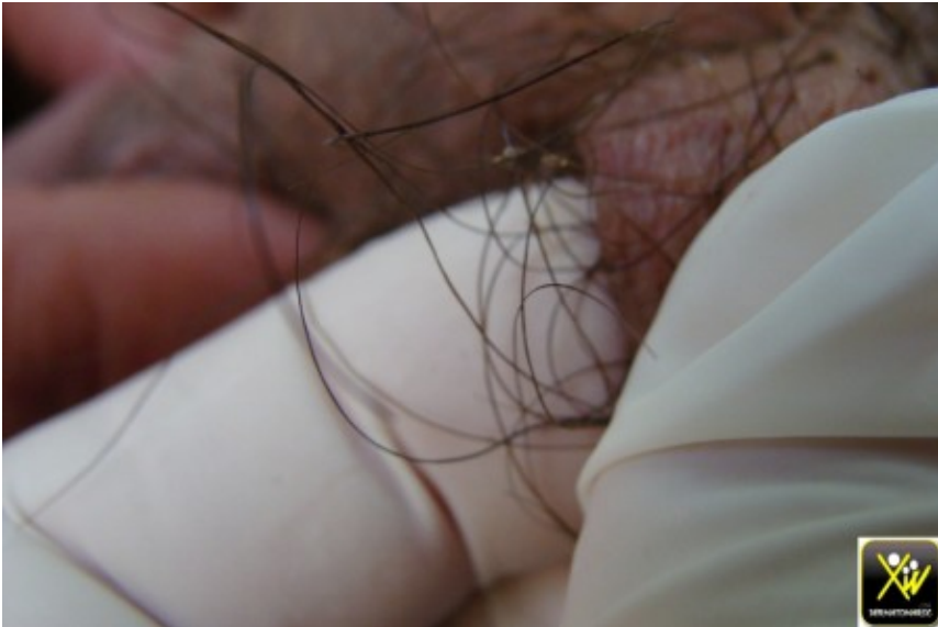
Prurit Pubien isolé.