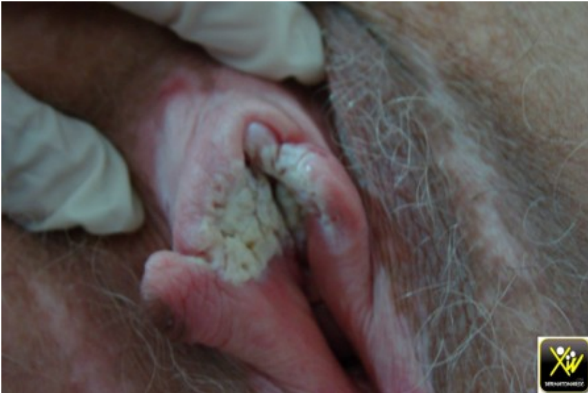
Prurit vulvaire et ulcération.