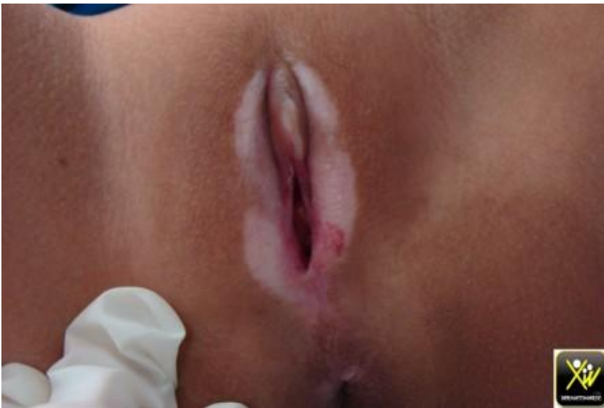
Fillette avec Prurit vulvaire.

Cette fillette se plaint d'un Prurit vulvaire insupportable.