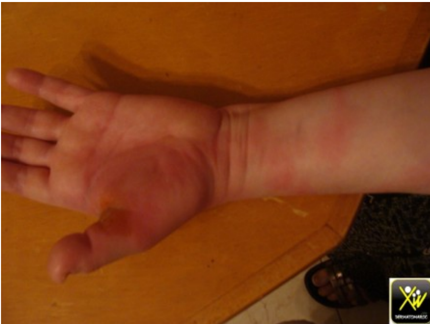
Érythème centrifuge isolé après blessure

Cet Érythème centrifuge isolé après blessure par manipulation de poissons.