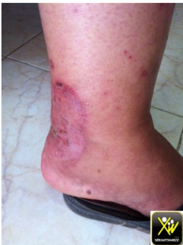
Érythème centrifuge bordé de