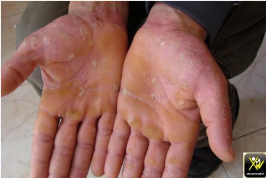
Pustulose aigue palmaire.