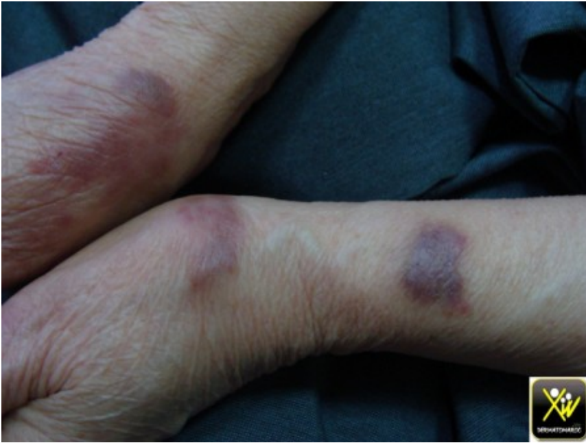
Tumeurs et plaques violacées.