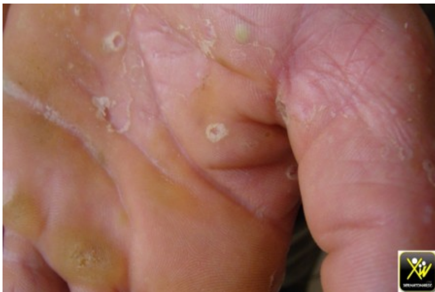
Pustulose aigue palmaire.