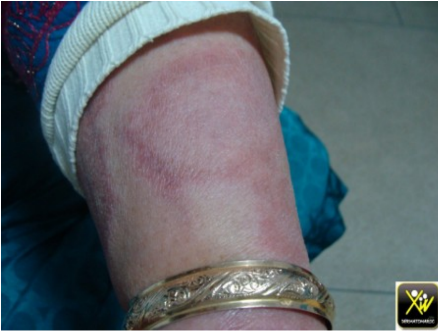
Érythème centrifuge avec anesthésie locale