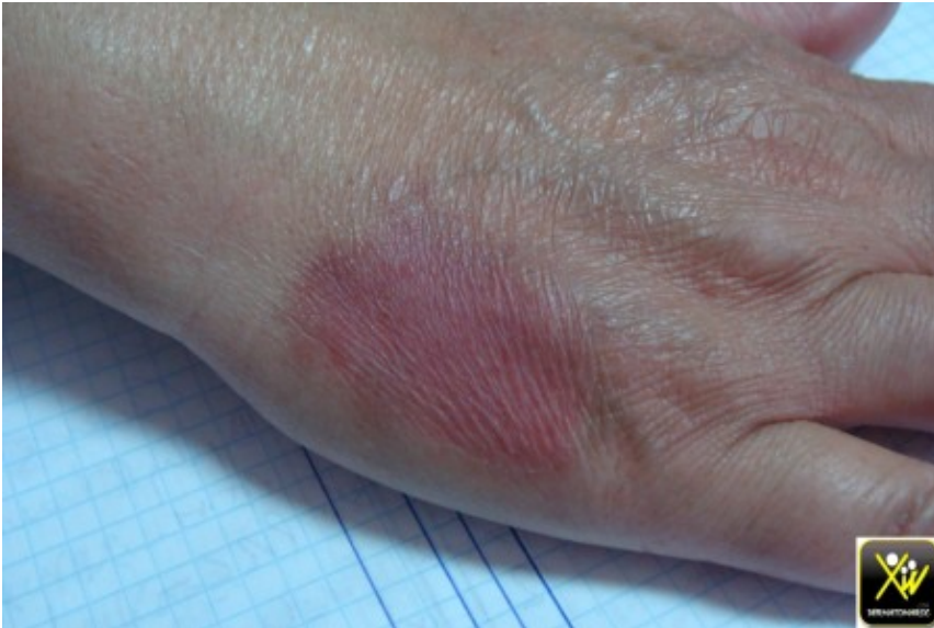
Érythème récidivant et fixe