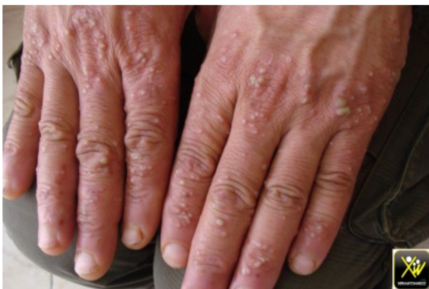
Pustulose aigue palmaire.