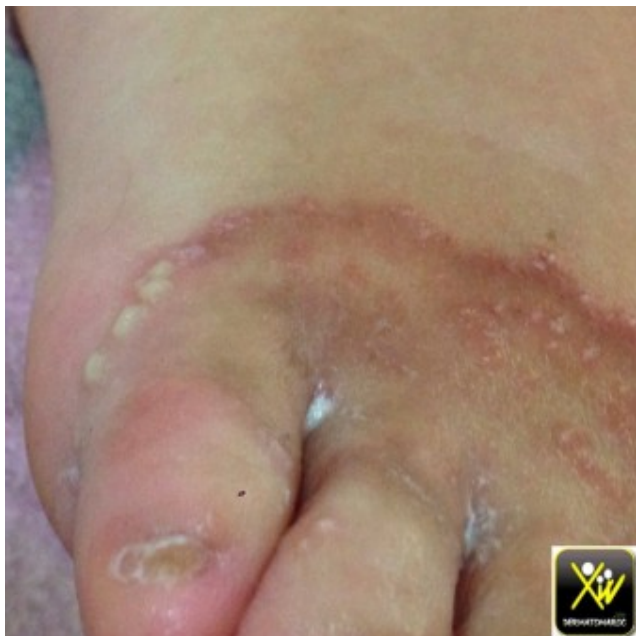
Érythème centrifuge bordé de pustules

Ces deux patients présentent un Érythème centrifuge bordé de pustules, il est