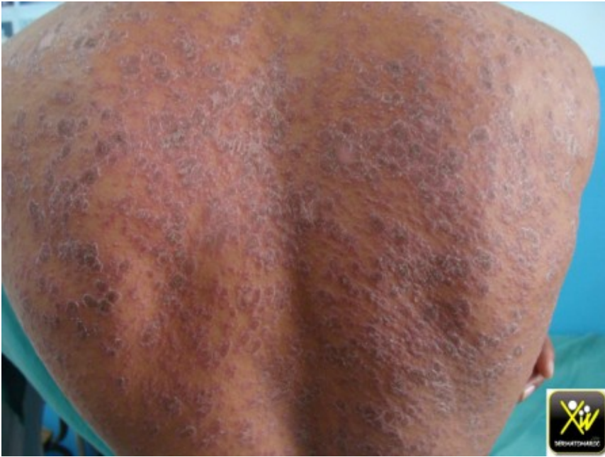
Macules squameuses du tronc