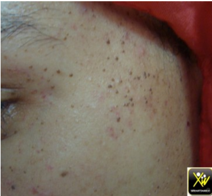
Papules du visage

Cette fille consulte pour l'apparition de multiples Papules du visage sans signes associés.