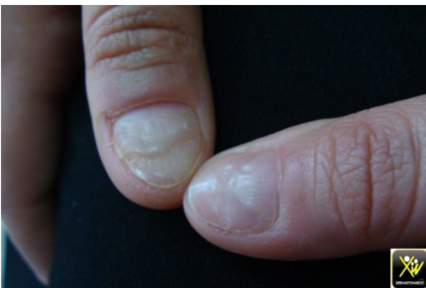
Sillons multiples des ongles.