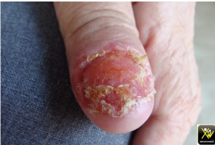
Onycholyse des pouces et des gros orteils