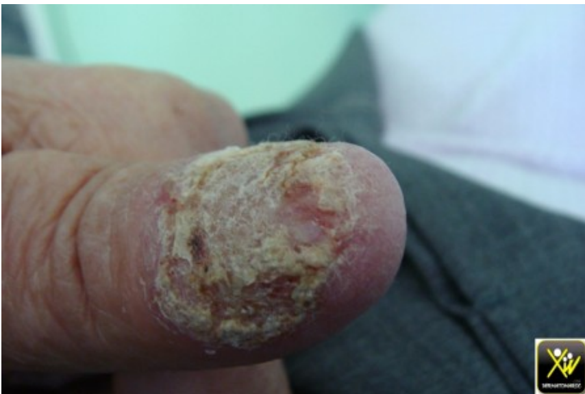
Onycholyse des pouces et des gros orteils