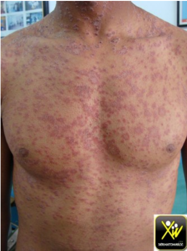
Macules squameuses du tronc

La lésion rose et squameuse en périphérie s'est généralisée après l'application d'Ascabiol.