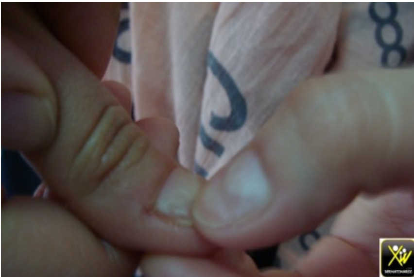
Sillons multiples des ongles.

Cet homme consulte pour des sillons multiples des pouces. A quoi vous pensez?