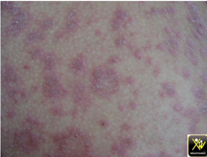
Macules squameuses du tronc

Ce jeune patient consulte pour la generalisation de Macules squameuses au tronc.