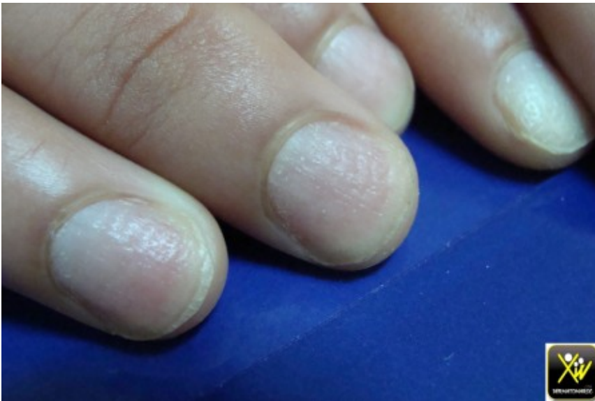
Ponctuations et dpressions unguales

Ponctuations et dpressions unguales sont assez vocatrices du psoriasis quand elles sont larges, profondes et irrregulieres, mais ne justifient en aucun cas de condamner le patient a une maladie chronique et de lourdes consequences psychosociales.