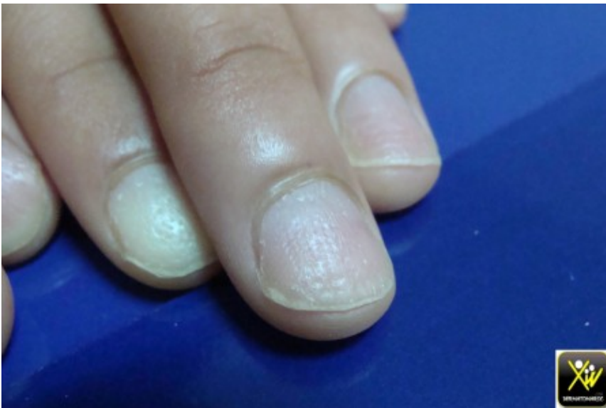
Ponctuations et dpressions unguales

Le classique ongle en De a coudre est a prendre avec prcaution car n'est pas spcifique.