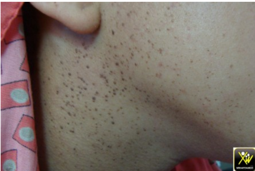
Papules du visage