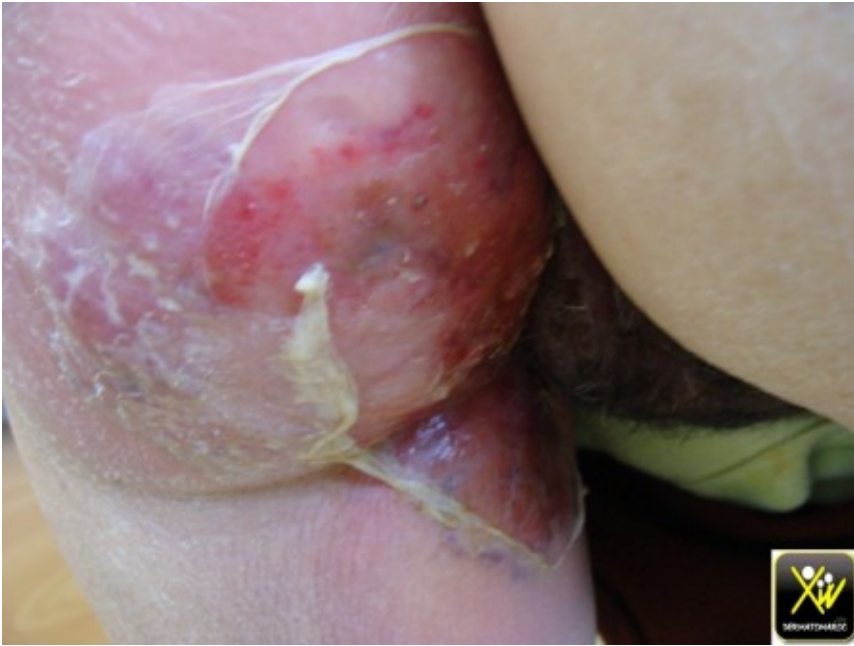
Décollement cutané fébrile.