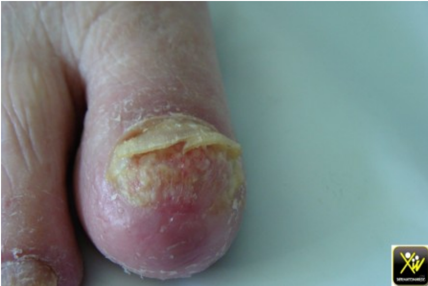
Onycholyse des pouces et des gros orteils