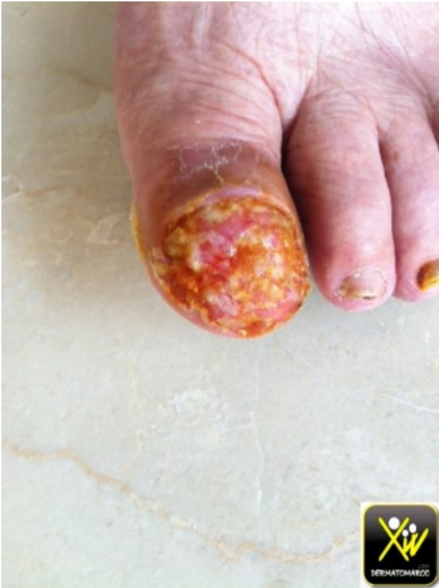
Onycholyse des pouces et des gros orteils