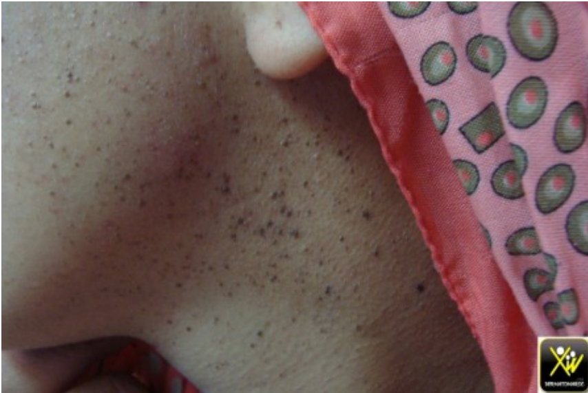
Papules du visage