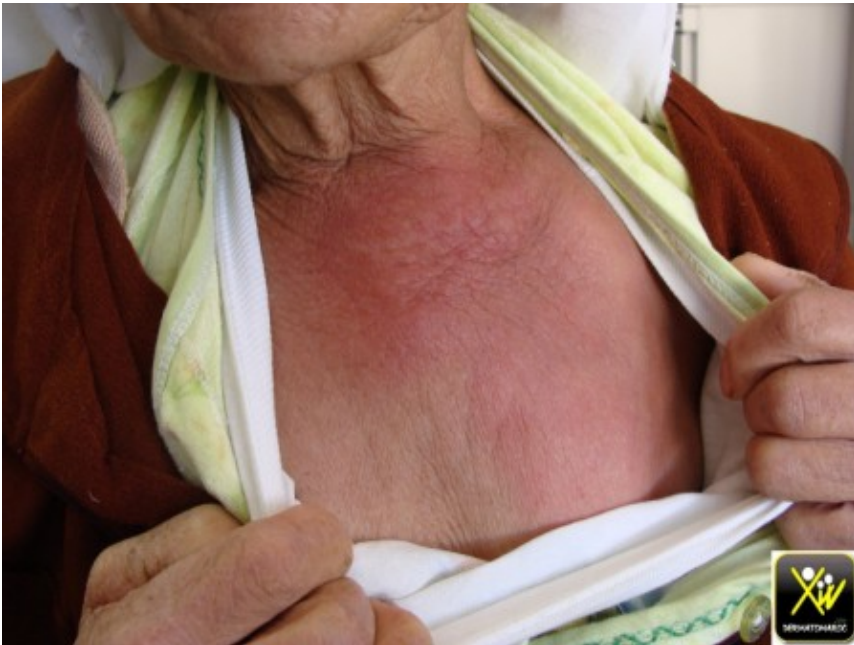
Décollement cutané fébrile.