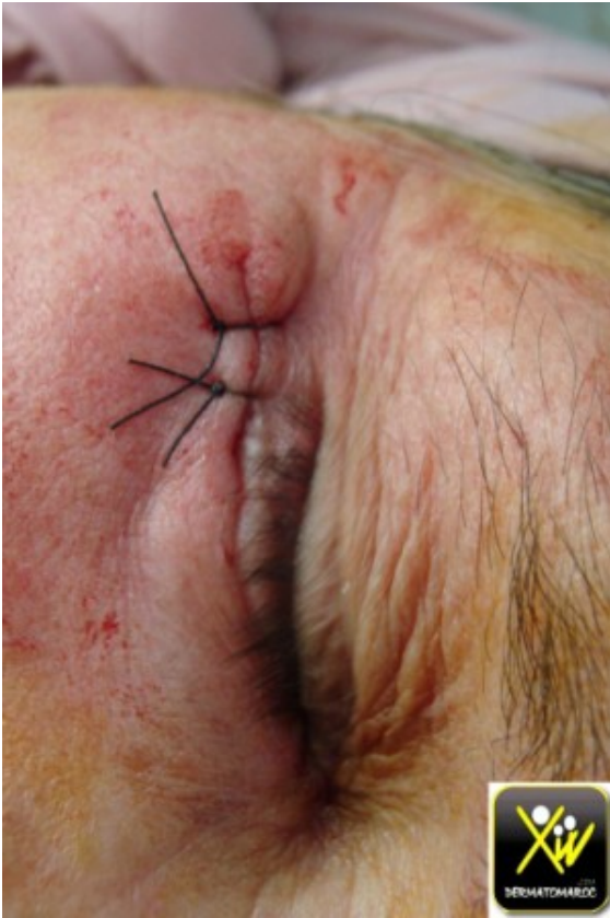
Ulcus rodens. exérèse.