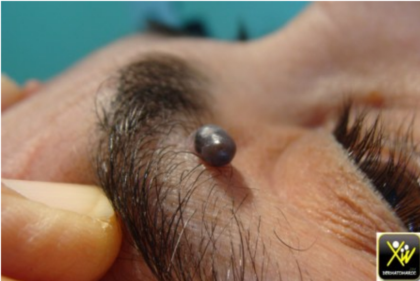
Tumeur pédiculée palpébrale