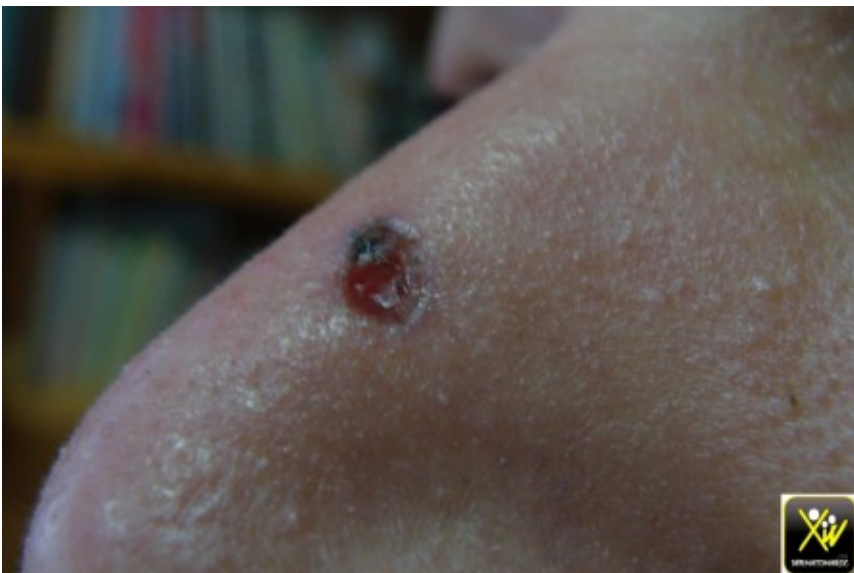
Carcinome baso cellulaire ulcéré.