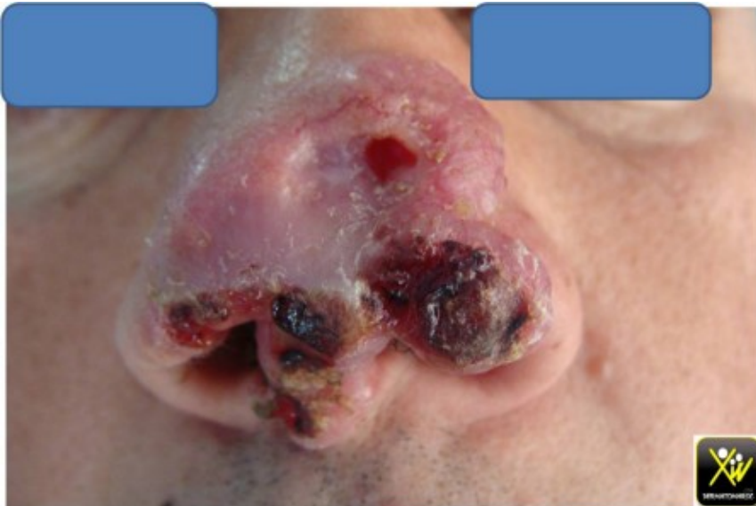
Carcinome baso cellulaire mutilant.