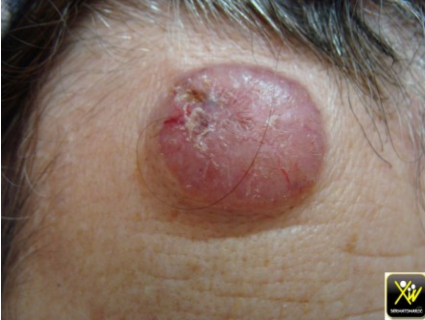
Carcinome baso cellulaire nodulaire.

Le Carcinome baso cellulaire nodulaire est une perle unique parcourue de telangiectasies caractéristiques