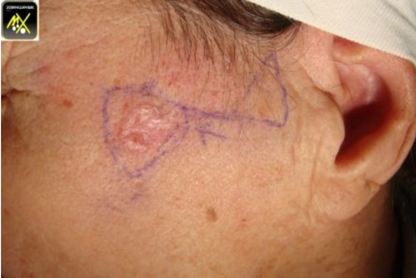
Carcinome baso cellulaire plan cicatriciel.