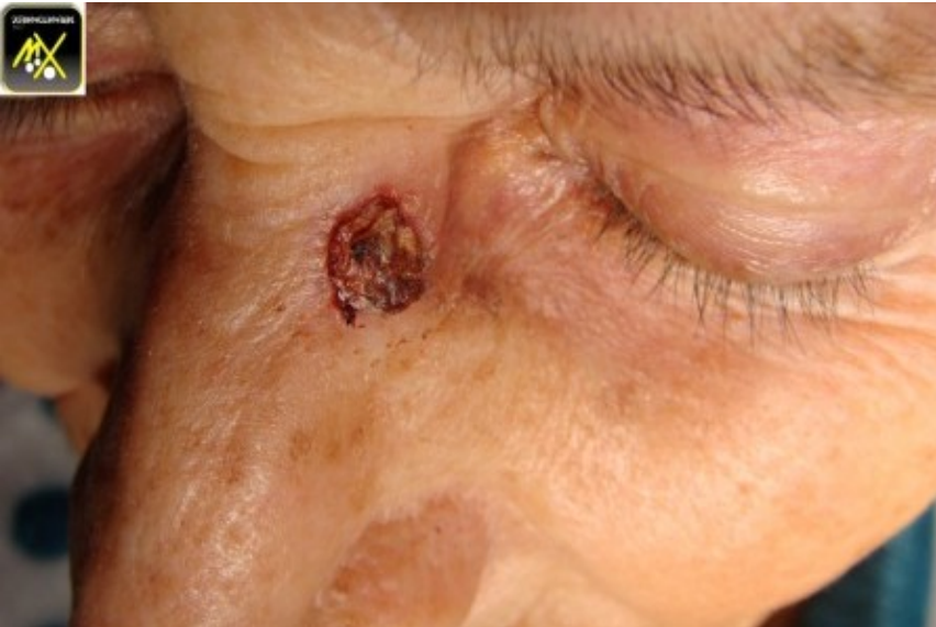
Carcinome baso cellulaire croûteux.