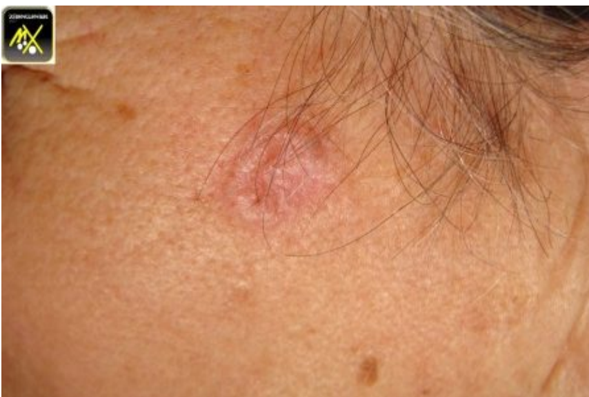
Carcinome baso cellulaire plan cicatriciel.

Le Carcinome baso cellulaire plan cicatriciel mérite une attention particulière.