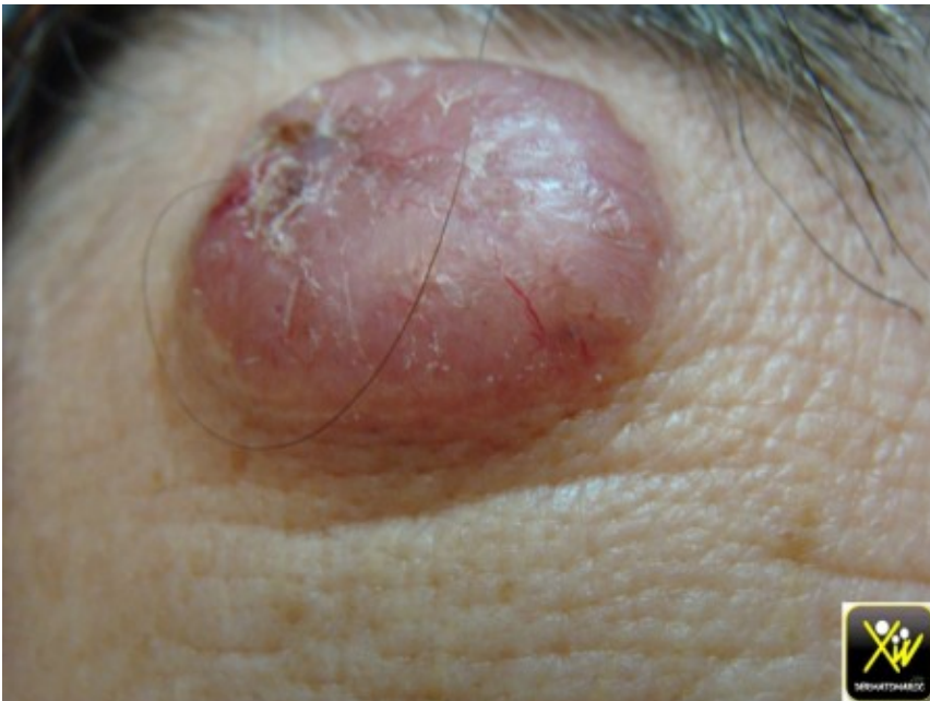
Carcinome baso cellulaire nodulaire.