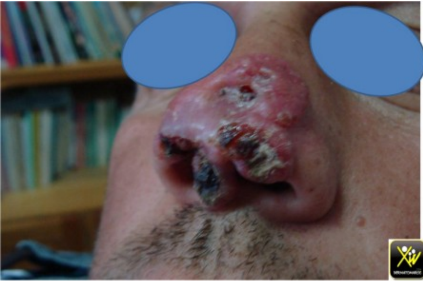
Carcinome baso cellulaire mutilant.