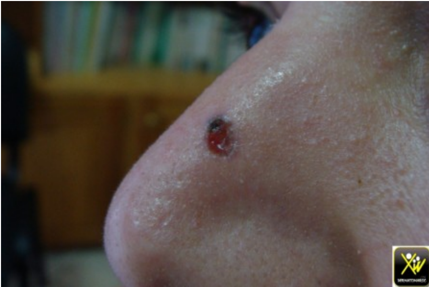
Carcinome baso cellulaire ulcéré.